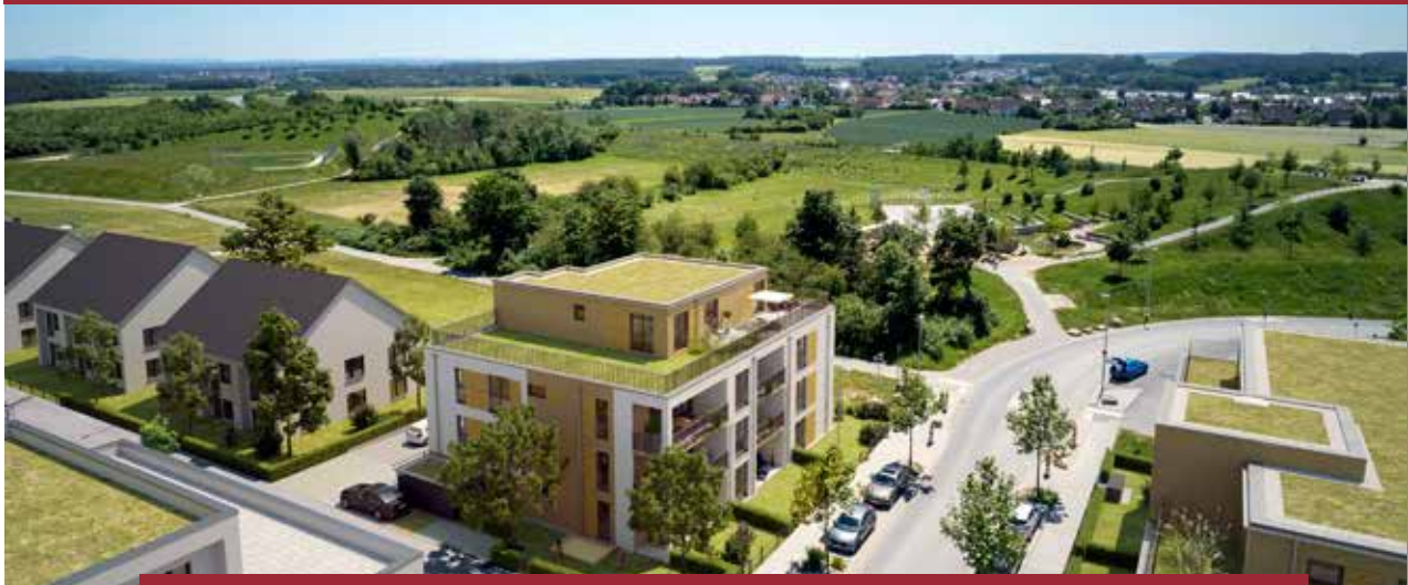
Der endgültige Bedarfsausweis liegt noch nicht vor. Abbildung kann von der endgültigen Bauausführung abweichen.